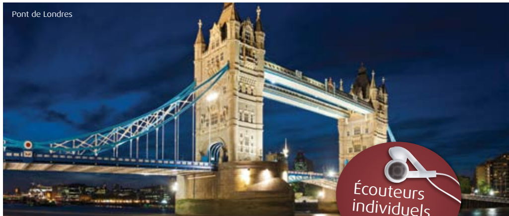
Pont de Londres